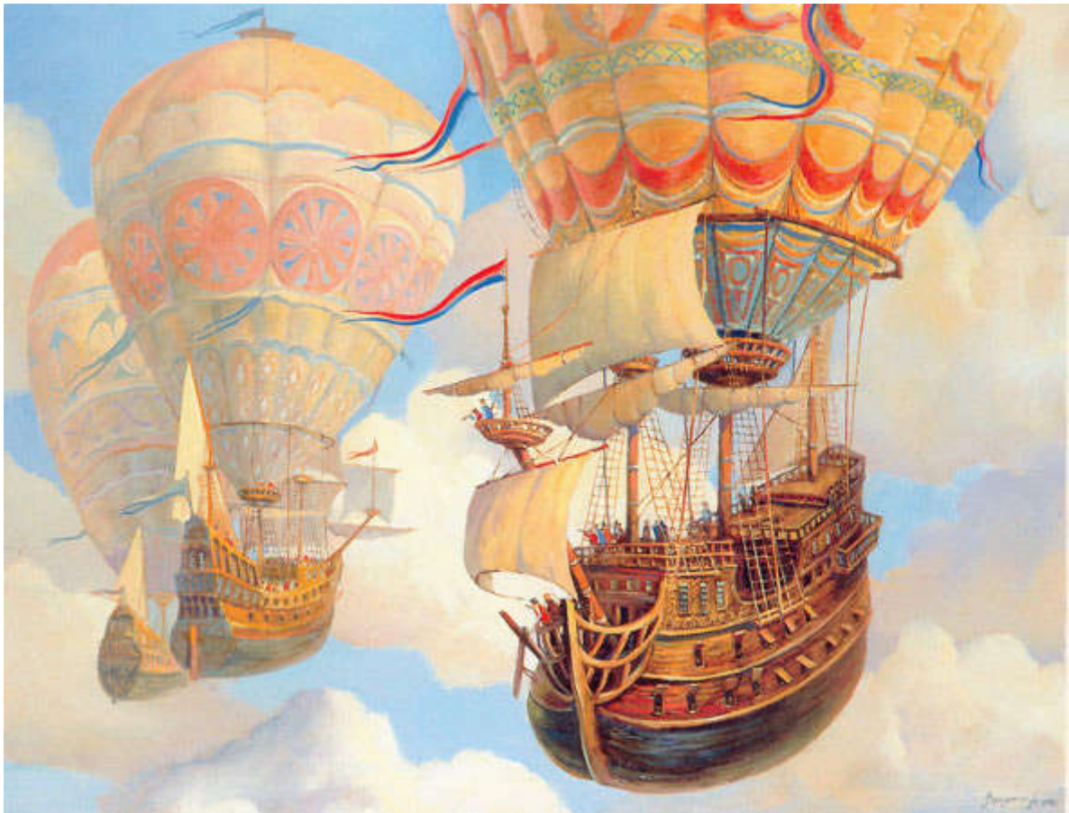
Художник Андрей Верещагин

Стихи и сказки о Галактическом Ковчеге и сказочных кораблях