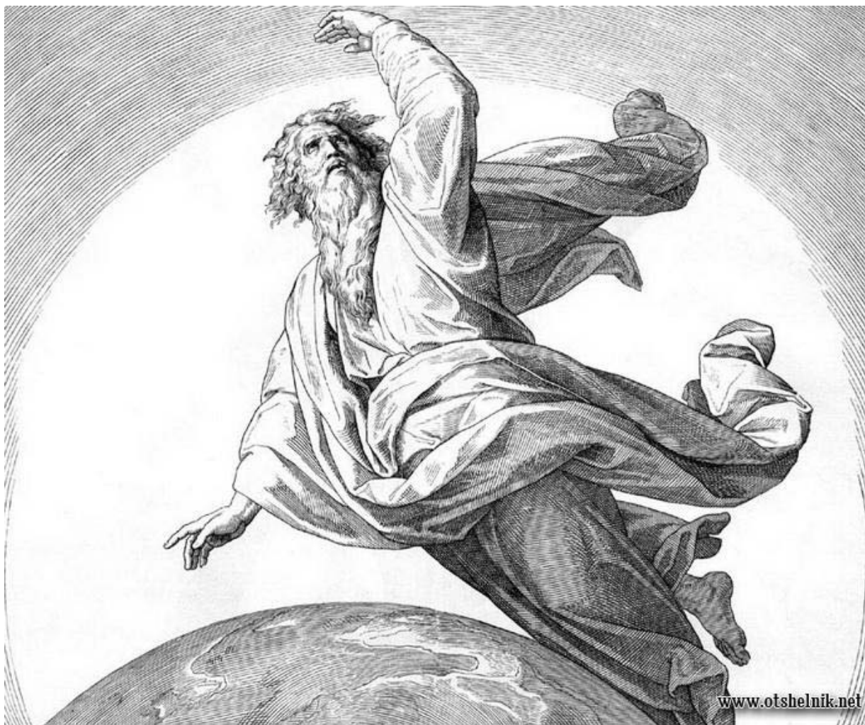
Шнорр фон Карольсфельд Юлиус (1794—1872)

Сотворение человека. Беседы мастеров «Галактического Ковчега». Книга первая / Составитель Феано. Москва 2018 г., кол-во стр. 166